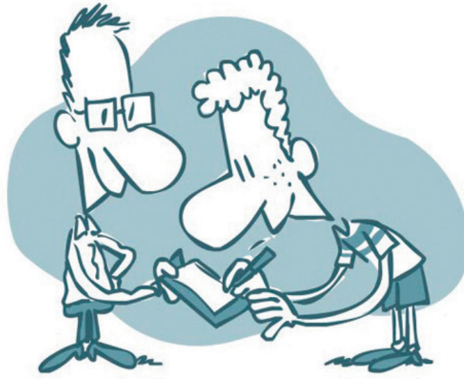
Регистрация на пункте допинг-контроля