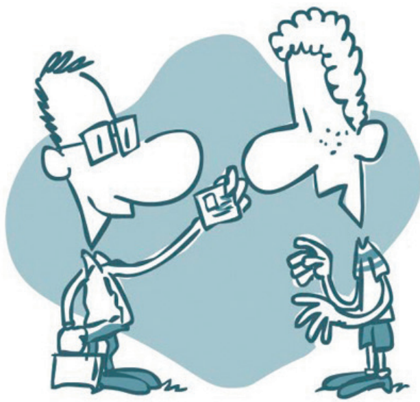
Уведомление спортсмена о необходимости сдать пробу