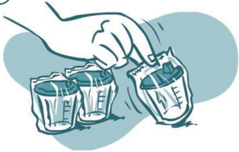
Выбор мочеприемника (емкости для сдачи пробы)