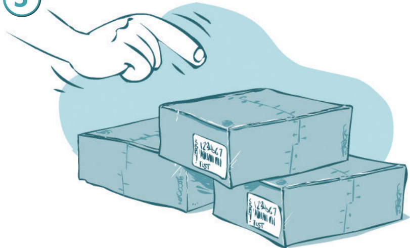
Выбор комплекта для хранения пробы