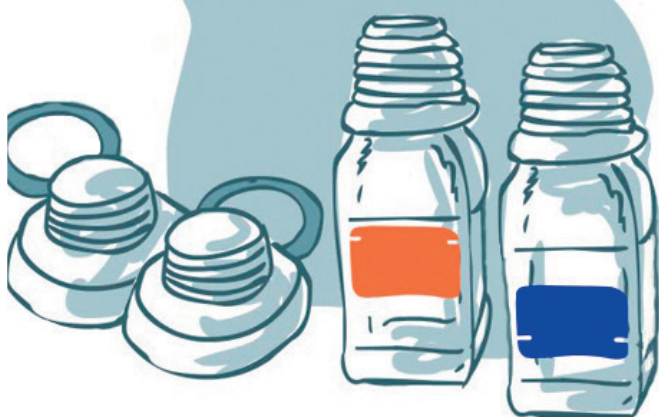
Разделение пробы по флаконам «А» и «В»