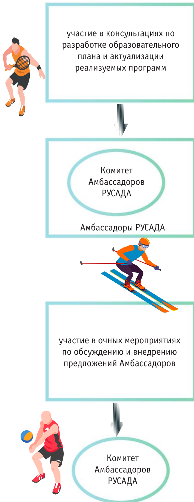
Рисунок 2. Задачи Амбассадоров РУСАДА и Комитета Амбассадоров РУСАДА